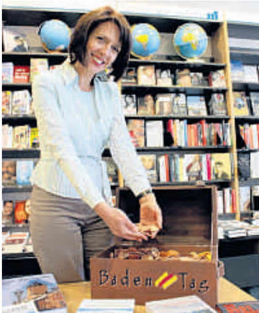
Zum „Baden-Tag“ wird die „Durlacher Münze“ geprägt.

Alle Informationen gibt es auch im Internet: www.baden-tag.de . (ps)